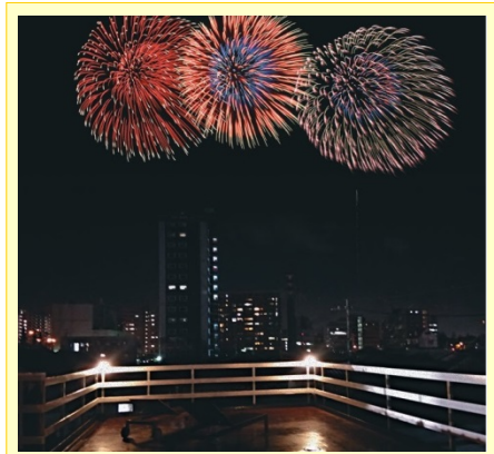
屋上からはわっしょい百万夏祭りの花火が とても大きくキレイに見えて感動的です！